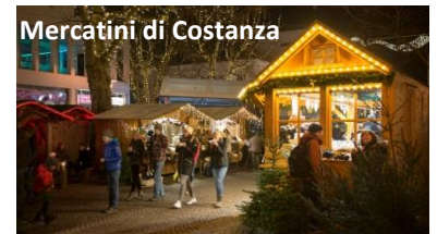
Mercatini di Costanza

visitare la mostra dedicata all'inverno scandinavo. Al termine trasferimento a Costanza e tempo a disposizione per il pranzo e per la visita dei Mercatini di Natale. La città di Costanza, da cui il nome del Lago è situata al confine con la Svizzera ed è famosa per il Concilio di Costanza, dove le maggiori autorità ecclesiastiche si riunirono per porre fine allo scisma del cristianesimo. Nel pomeriggio rientro a Friedrichshafen. Cena e pernottamento.