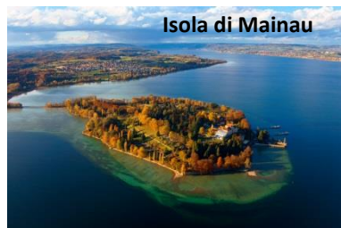
Isola di Mainau

candele, dolciumi e prelibatezze. Tempo a disposizione per la visita libera dei Mercatini di Natale. Chi volesse può visitare il Museo Ravensburger (ingresso a pagamento), azienda famosa per i suoi puzzle. Alle ore 16,00 circa trasferimento a Friedrichshafen. Sistemazione in hotel e tempo a disposizione per visitare i Mercatini di Natale situati sul Lago a fianco al museo Zeppelin. Cena e pernottamento in hotel.